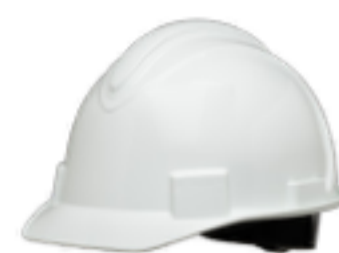
Casco con visera corta Honeywell North REF.: NSB10001E

Rendimiento mejorado, comodidad durante todo el día y durabilidad: el casco con visera corta Honeywell North combina la experiencia de dos marcas mundialmente reconocidas para crear una solución de protección de la cabeza certificada que ofrece versiones con ventilación y sin ella. No tiene que elegir entre precio y calidad. Puede tener ambas.