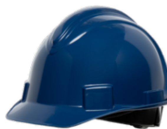
Azul oscuro NSB10071E