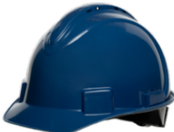
Azul oscuro NSB11071E