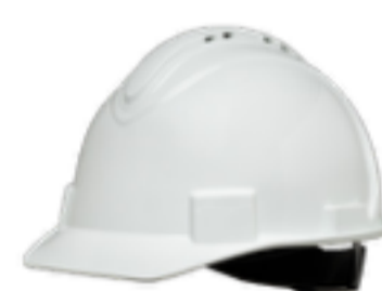
Casco con visera corta Honeywell North con ventilación REF.: NSB11001E